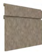
VASSOLA SERIE Q