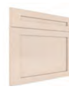
VICENZA SERIE J