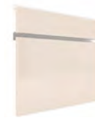
PC SERIE E