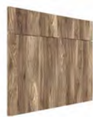
BREMEN SERIE J