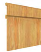
CRETA CHAPA SERIE Q