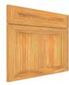
PISA SERIE J