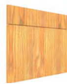
TOLEDO SERIE J