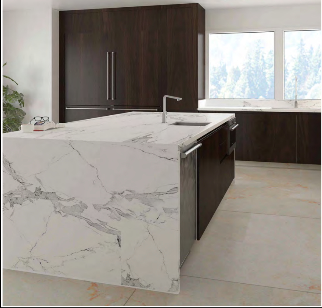
Modelo: Imola + CHM