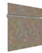
TREVISO SERIE E