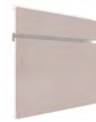
ALK SERIE E