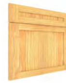
TORONTO SERIE J