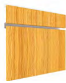
PM SERIE E