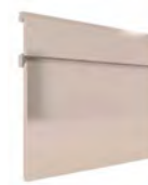
CRETA LACA SERIE Q