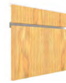
CHM SERIE E