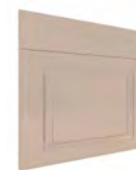
VERONA SERIE J