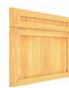
LIMA FLAT SERIE J