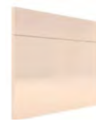
OSLO SERIE J