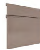
IMOLA LACA SERIE Q