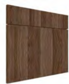
IBERIA SERIE J