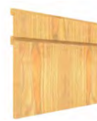
MILÁN SERIE Q