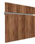
PMT SERIE E