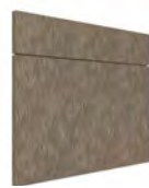
MURANO SERIE J