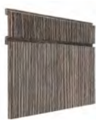
TURÍN MT SERIE Q