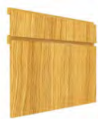
MONZA SERIE Q